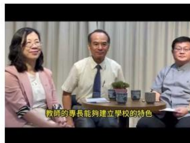
三、開學了!我不是新 手