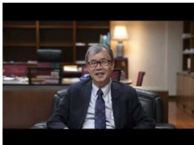
教育部長官致詞祝福