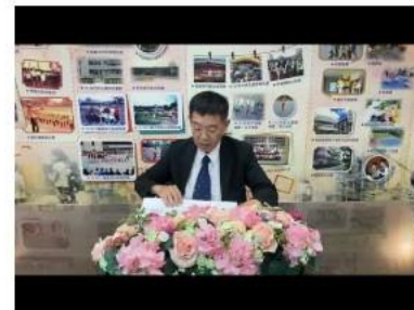
黃金三階段課程說明 介紹