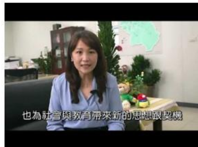
縣市政府教育局 (處) 長官祝福影片