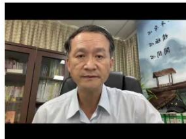
校長協會理事長祝福