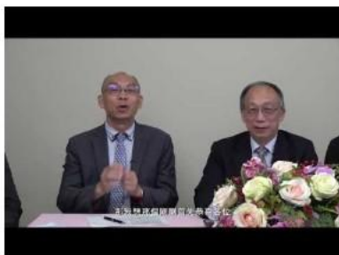
一、面對榮耀與責任