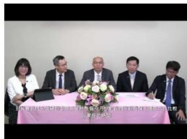
二、初任校長的暑假